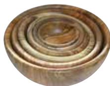
Set 6 Schalen

Art.-Nr. 50680 Länge 13 cm Material Olivenholz EAN 3700598607762 VE 4