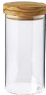
Behälter (Borosilikatglas) mit Olivenholz-Deckel groß

Art.-Nr. 35101 Länge 600ml, ø 10 cm, 15 cm hoch Material Olivenholz EAN 3700598604860 VE 4