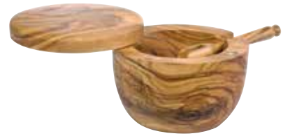
Salzbehälter mit Deckel und Löffel

Art.-Nr. 90070 Länge ø 10-11 cm Material Olivenholz EAN 3700598601562 VE 1