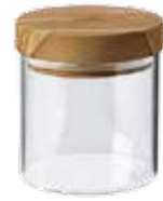
Behälter (Borosilikatglas) mit Olivenholz-Deckel klein

Art.-Nr. 35100 Länge 400ml, ø 10 cm, 11 cm Material Olivenholz EAN 3700598604853 VE 4