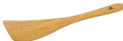
„Contour“ Wender gebogen

Art.-Nr. 20275 Länge 36 cm Material Olivenholz EAN 3700598600299 VE 12