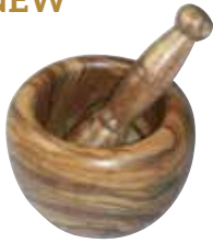
Mörser mit Stößel

Art-Nr. 90071 Länge ø 10-11 cm Material Olivenholz EAN 3700598601579 VE 2