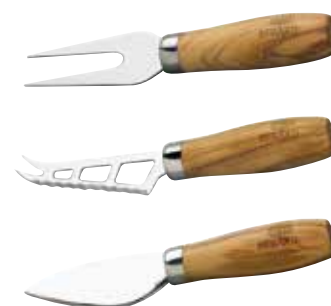
Käse Set, dreiteilig

Art.-Nr. 21450 Länge 20 cm Material Olivenholz EAN 3700598604211 VE 1