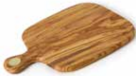
Schneidebrett mit Griff

Art.-Nr. 54600 Länge 29 x 20 x 13 cm Material Olivenholz EAN 3700598607182 VE 6