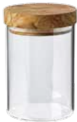
Behälter (Borosilikatglas) mit Olivenholz-Deckel mittel

Art.-Nr. 35103 Länge 1500ml, ø 10 cm, 31 cm hoch Material Olivenholz EAN 3700598604884 VE 4