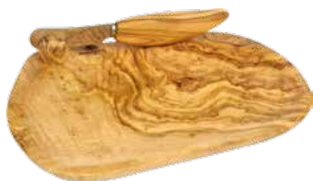
Käse Brett mit Messer

Art.-Nr. 56178 Länge 32,5 x 17,5 cm Material Olivenholz EAN 3700598601005 VE 1