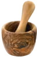
Mörser mit Stößel

Art-Nr. 90073 Länge ø 14-15 cm Material Olivenholz EAN 3700598601593 VE 1