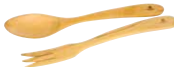
„Contour“ Salat-Besteck gebogen

Art-Nr. 03150 Länge 30 cm Material Olivenholz EAN 3700598604198 VE 2