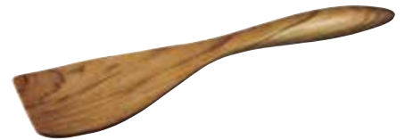
„Terra“ Wender groß

Art.-Nr. 66770 Länge 36 cm Material Olivenholz EAN 3700598601357 VE 6