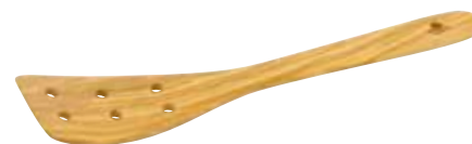
„Contour“ Wender mit 6 Löchern

Art.-Nr. 20670 Länge 15,5 cm Material Olivenholz EAN 3700598600305 VE 24