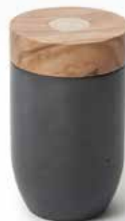
Salz- und Pfeffermühlen Millenari

Art-Nr. 41181 Länge ø 7 x 12 cm Material Olivenholz EAN 3700598607700 VE 4