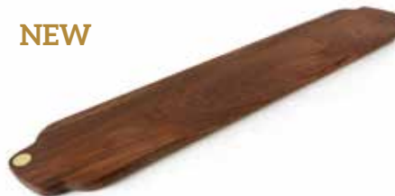
Servierbrett mit Griff

Art.-Nr. 70080 Länge 64 x 16 x 2,4 cm Material Walnussholz EAN 3700598607434 VE 2