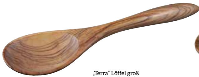
„Terra“ Löffel groß

Art-Nr. 22772 Länge 33 cm Material Olivenholz EAN 3700598600466 VE 6