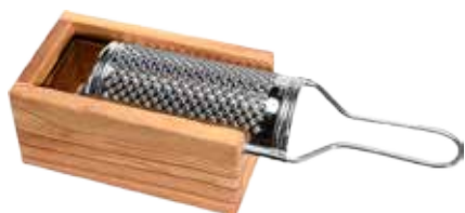
Parmesan Box mit Reibe

Art.-Nr. 12990 Länge 15 x 7 x 8,5 cm Material Olivenholz EAN 3700598606796 VE 2