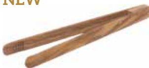
Zangen Olea Europea

Art.-Nr. 52178 Länge 16,5 cm Material Olivenholz EAN 3700598600749 VE 6