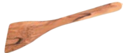
Wender - groß/schräg

Art.-Nr. 66574 Länge 30 cm Material Walnussholz EAN 3700598601326 VE 12