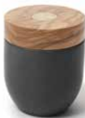
Salz- und Pfeffermühlen Millenari

Art-Nr. 41191 Länge ø 8 x 10 cm Material Olivenholz EAN 3700598607724 VE 4