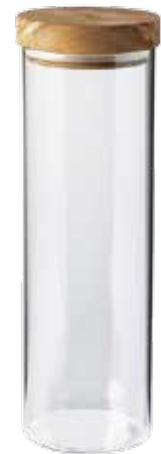
Behälter (Borosilikatglas) mit Olivenholz-Deckel

Art.-Nr. 35100 Länge 400ml, ø 10 cm, 11 cm Material Olivenholz EAN 3700598604853 VE 4