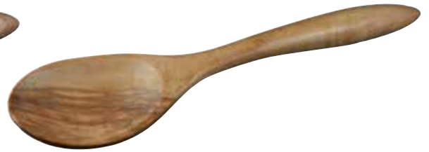
„Terra“ Löffel klein

Art-Nr. 22772 Länge 33 cm Material Olivenholz EAN 3700598600466 VE 6