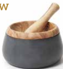
Mörser Millenari mit Baumwolltasche

Art-Nr. 41300 Länge ø 20 x 10 cm Material Olivenholz EAN 3700598607595 VE 1