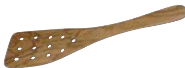
Gebogener Wender mit 12 Löchern

Art.-Nr. 66475 Länge 32 cm Material Olivenholz EAN 3700598601258 VE 9