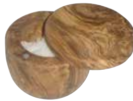
Salzbehälter mit Deckel

Art.-Nr. 90070 Länge ø 10-11 cm Material Olivenholz EAN 3700598601562 VE 1